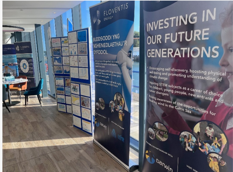
Un o'n Diwrnodau Ymwybyddiaeth Gyhoeddus yng Ngwesty'r Ty.

Mae hyn yn dilyn cyfres o Ddiwrnodau Ymwybyddiaeth Gyhoeddus a gynhaliwyd gennym ym mis Gorffennaf 2023, gyda'r nod o gyflwyno ein prosiectau a chodi ymwybyddiaeth ynghylch ein cynigion i drigolion a phartion sydd â diddordeb ar draws y rhanbarth.