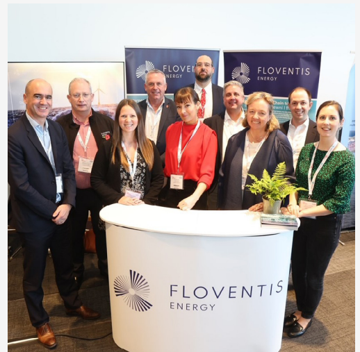
Tîm Floventis yng Nghynhadledd Ynni Dyfodol Cymru.

Cyfarwyddwr Polisi a Chysylltiadau Allanol