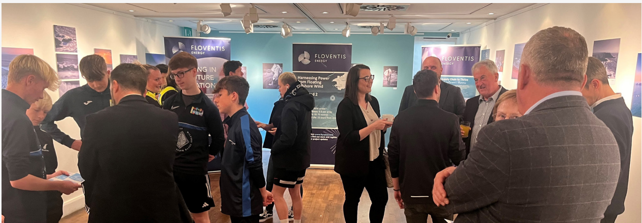
Lansiad Materion Dyfodol Aberdaugleddau.

Mae eich barn yn bwysig er mwyn ein helpu i ddeall yr ardal leol yn well ac unrhyw effeithiau posibl y gallai ein cynllun eu cael arnoch chi a'ch cymuned. Bydd yr holl ymatebion i'r ymgynghoriad cyhoeddus yn cael eu cofnodi mewn adroddiad ymgynghori, a fydd yn rhan o'n ceisiadau am gydsyniad.